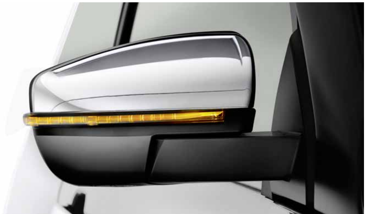
Aussenspiegel mit LED-Blinker, Serie